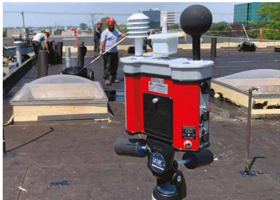
Cet appareil nommé WibGeT est utilisé par un expert pour capter la température de l'air corrigée.

Les météorologistes prévoient de plus en plus de canicules dans les années à venir. Le SQC s'engage ainsi à maintenir la diffusion des messages entourant les risques liés au travail à la chaleur en saison estivale. C'est vital.