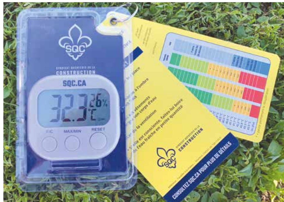
Cette station météo a été développée par le SQC afin de calculer la température de l'air corrigée.

La CNESST a développé une méthode de calcul de l'indice de la température de l'air corrigée (TAC). Elle est facile à utiliser et efficace pour protéger la plupart des personnes qui travaillent à l'extérieur dans des conditions climatiques chaudes. Cependant, cette approche sous-estime les contraintes thermiques intenses, comme les travaux d'asphaltage et de couverture, car beaucoup de chaleur y est produite par rayonnement (Réf. IRSST/R-476). Les représentants SQC ont donc visité un chantier plus à risque avec un expert hygiéniste industriel du réseau de la santé publique pour mesurer l'indice WBGT (Wet Bulb Globe Temperature) à l'aide d'un instrument spécialement conçu à cet effet, le WibGeT. Les résultats sont inquiétants. Les travailleurs et employeurs œuvrant dans ces conditions de travail doivent redoubler de prudence. Ils doivent prendre des mesures de prévention et respecter leurs obligations.