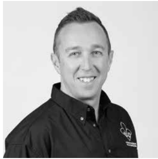
PAR STEVE PRESCOTT COORDONNATEUR SANTÉ ET SÉCURITÉ

Depuis quelques années, la chaleur est devenue un danger de plus en plus important sur nos chantiers. L'an dernier, un travailleur est décédé d'un coup de chaleur après sa journée de travail. En 2019, la chaleur a occasionné plusieurs victimes ayant souffert de malaises. Certains décès restent à confirmer également.