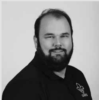
PAR CHARLES-OLIVIER PICARD COORDONNATEUR RELATIONS DU TRAVAIL

Le harcèlement et l'intimidation peuvent prendre plusieurs formes. Les recours possibles doivent être choisis en fonction des situations vécues. Comme votre employeur a l'obligation de s'assurer que votre milieu de travail est sain, il doit intervenir dans ces cas. Sinon, il devient automatiquement fautif, même sans en être l'instigateur.