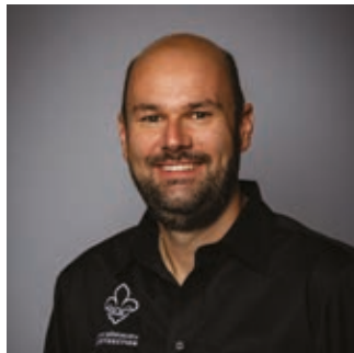
PAR CHARLES-OLIVIER PICARD COORDONNATEUR RELATIONS DU TRAVAIL

Depuis la pandémie, voire avant, deux sujets majeurs nous interpellent et ils continueront à attirer fortement notre attention en 2023 : le recrutement de travailleurs étrangers dans un contexte de rareté de main-d'œuvre et la réforme de l'assurance-emploi. Plongeons tout de go au cœur de ces deux dossiers.