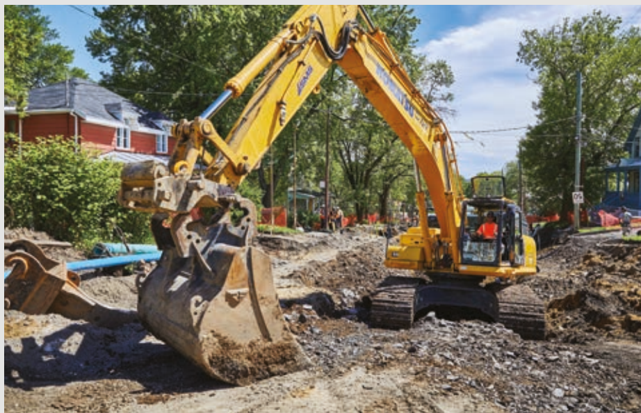
Activités en chantier : informations tirées de la CCQ, Prévision des heures travaillées 2022-2027 .

Sans vouloir noircir ces perspectives encourageantes, rappelons tout de même que la rareté de la main-d'œuvre demeure un frein à la croissance de notre industrie. Pour que la construction reste productive dans les années à venir, l'amélioration des conditions de travail, la formation, la stabilité d'emploi et le respect des règles de santé et de sécurité devront être au cœur des changements structurels.