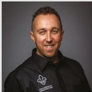
PAR STEVE PRESCOTT COORDONNATEUR SANTÉ ET SÉCURITÉ

Nous y sommes enfin ! Après une attente de plus de 42 ans, la Loi modernisant le régime de santé et de sécurité du travail, sanctionnée le 6 octobre 2021, exigera sous peu l'application de certains mécanismes de prévention sur les chantiers de construction.