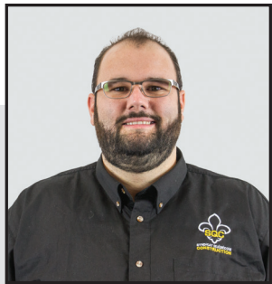
PAR CHARLES-OLIVIER PICARD CONSEILLER SYNDICAL

Le 24 septembre dernier, l'arbitre M e François Hamelin a déposé sa décision concernant les heures supplémentaires et les frais de déplacement dans les secteurs institutionnel et commercial, et industriel.