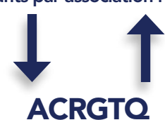
TABLE SECTEUR RÉSIDENTIEL

2 représentants par association représentative