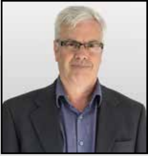
PAR SYLVAIN GENDRON PRÉSIDENT-DIRECTEUR GÉNÉRAL

Bien que l'industrie ait enregistré une stabilité des heures travaillées au cours de la dernière année, elle se situe bel et bien dans un cycle baissier depuis cinq ans. La baisse des heures se fait cependant tout en douceur.