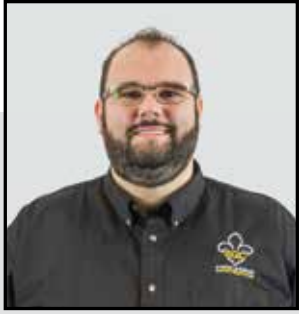
PAR CHARLES-OLIVIER PICARD CONSEILLER SYNDICAL

Dans notre industrie, les différents métiers et occupations cohabitent sur les chantiers. La rencontre de travailleurs et de travailleuses aux expertises distinctes est donc usuelle, fréquente, voire quotidienne. En effet, les nombreuses étapes d'un projet de construction, de rénovation ou d'agrandissement requièrent inévitablement le savoir-faire des divers métiers et occupations. Sur les chantiers, chacun doit s'exécuter selon ses compétences et les règles de l'industrie, à savoir selon les tâches pour lesquelles il est reconnu.