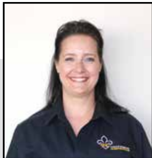
PAR ISABELLE C. PELLETIER AGENTE DE PROMOTION DE LA FORMATION