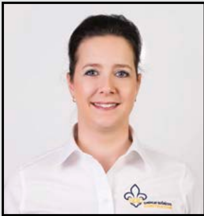
PAR ISABELLE C. PELLETIER AGENTE DE PROMOTION DE LA FORMATION

Il y a plus de 20 ans, l'industrie de la construction s'est dotée d'un fonds de formation pour financer et promouvoir votre perfectionnement. Ce fonds permet notamment de vous offrir gratuitement des activités et de vous rembourser, sous certaines conditions d'admissibilité, les frais engagés pour votre transport et votre hébergement. Des mesures incitatives non négligeables!