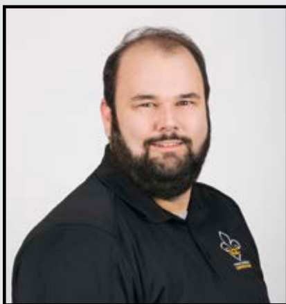
PAR CHARLES-OLIVIER PICARD COORDONNATEUR - RELATIONS DU TRAVAIL

Les chantiers de construction sont des environnements de travail très fluides où l'achalandage est élevé et les va-et-vient, constants. Par conséquent, le vol d'outils et de vêtements de travail y est plus probable que dans un milieu professionnel stable et fermé. Cette situation est évidemment frustrante, mais il est possible d'y remédier en prenant les moyens de prévention nécessaires.