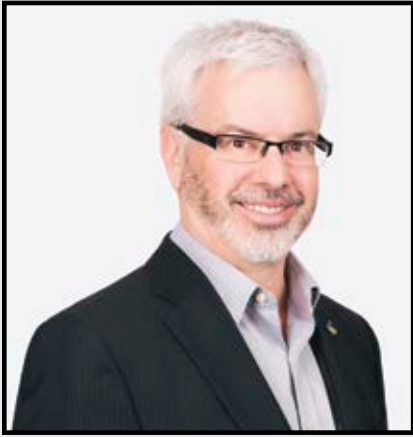
PAR SYLVAIN GENDRON PRÉSIDENT-DIRECTEUR GÉNÉRAL

D'un point de vue historique, ce sont les revendications syndicales qui ont fait voir le jour aux régimes d'assurance collective. Ces avantages sociaux ont pour but de protéger les travailleurs en leur procurant bien-être et sécurité financière.